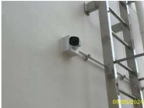
กล้องวงจรปิดบริเวณโครงการ