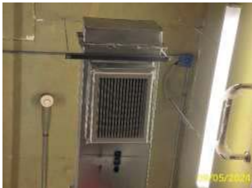
ระบบระบายอากาศห้องเครื่องสูบน้ำ