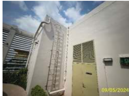
ถังสำรองน้ำชั้นดาดฟ้า