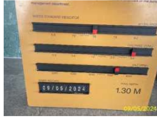
เจ้าหน้าที่ตรวจวัด pH และ chlorine