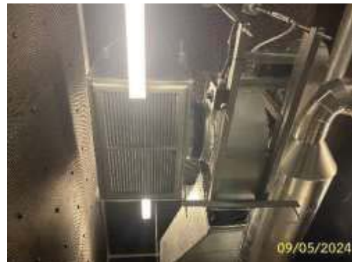
ระบบระบายอากาศห้องเครื่องไฟฟ้า