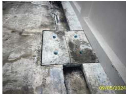
บ่อตรวจสอบการระบาย