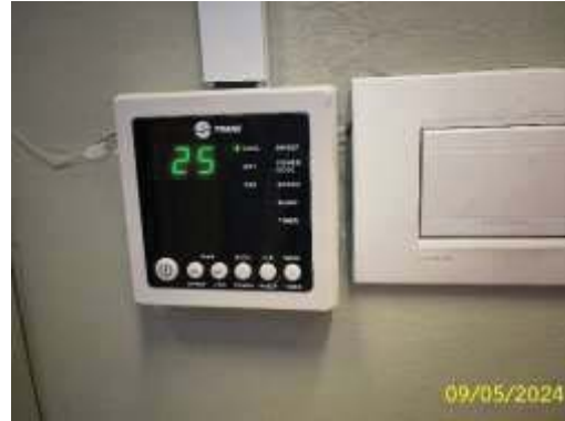
ระบบปรับอากาศ