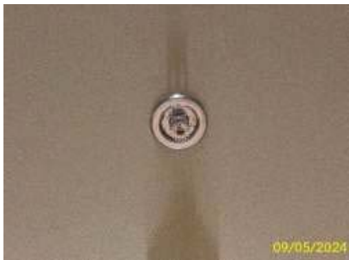
ระบบดับเพลิงแบบกระจายน้ำอัตโนมัติ ภาพที่ 1.3.10-1 ระบบป้องกันอัคคีภัย