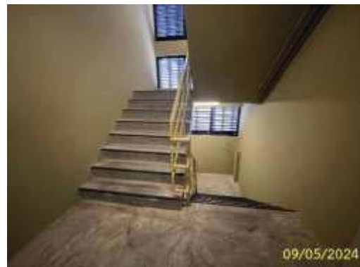
บันไดหนีไฟ ST-2