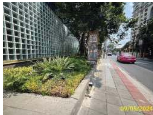
ที่ตั้งระบบบำบัดน้ำเสียของอาคารชุดพาณิชย์