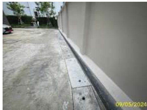
รางระบายน้ำ