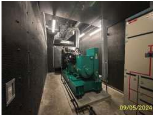
ระบบจ่ายไฟฟ้าสำรอง