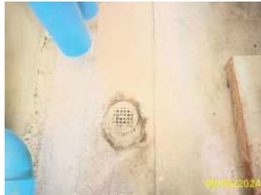
ท่อระบายน้ำในอาคาร