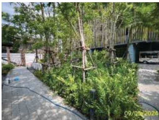
การบำบัดก๊าซมีเทนและ Aerosol