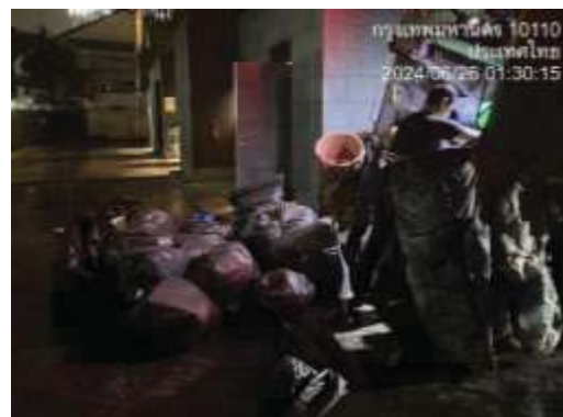
รถเก็บขนขยะสำนักงานเขต