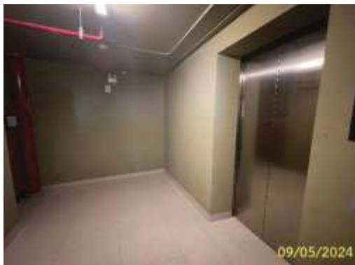
ลิฟต์ดับเพลิง