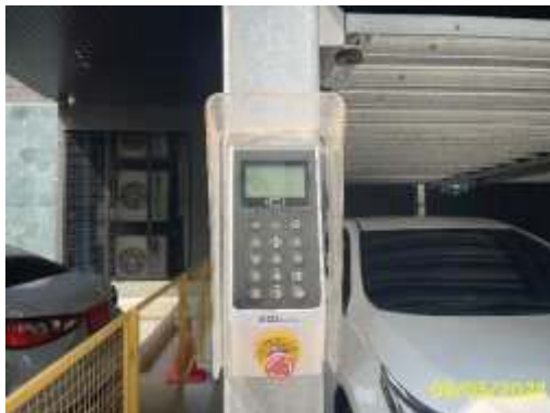
พื้นที่จอดรถยนต์แบบอัตโนมัติ