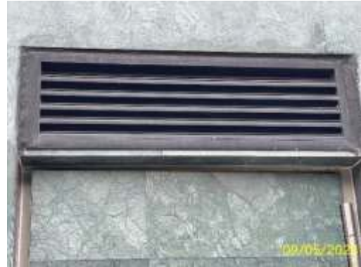
ห้องพักมูลฝอยรวม