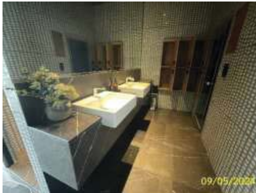
ห้องน้ำและห้องส้วม บริเวณสระว่ายน้ำ