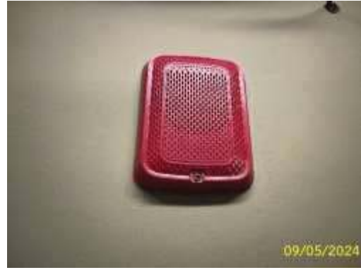
กริ่งสัญญาณแจ้งเหตุ