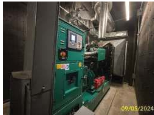
ระบบไฟฟ้าสำรอง