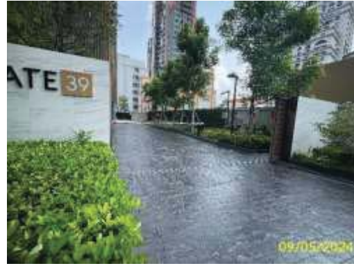
ทางเข้า-ออกโครงการ