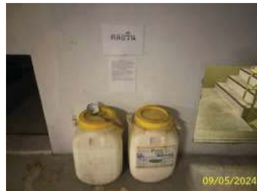
ห้องเก็บสารเคมี