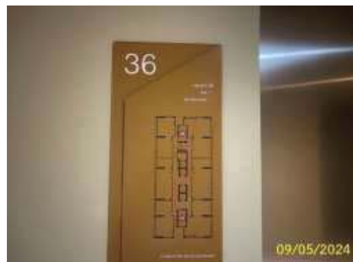
ป้ายบอกตำแหน่งจุดที่อยู่