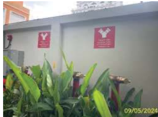
หัวรับน้ำดับเพลิง