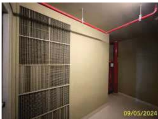
ระบบระบายอากาศแบบอัดอากาศ