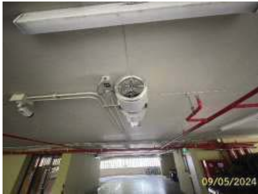
ระบบระบายอากาศบริเวณที่จอดรถยนต์