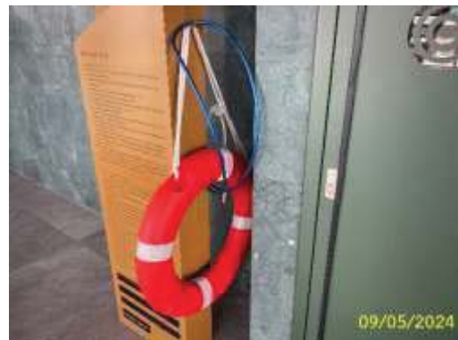
อุปกรณ์ช่วยชีวิตประจำสระว่ายน้ำ