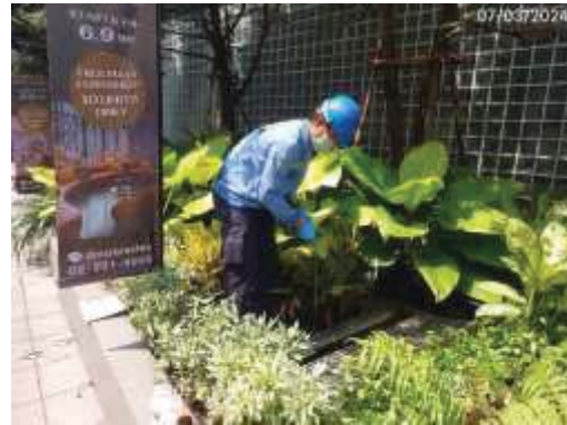
บริเวณบ่อตรวจคุณภาพน้ำ