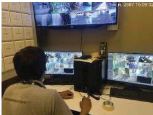
เจ้าหน้าที่ทำการตรวจสอบระบบ CCTV