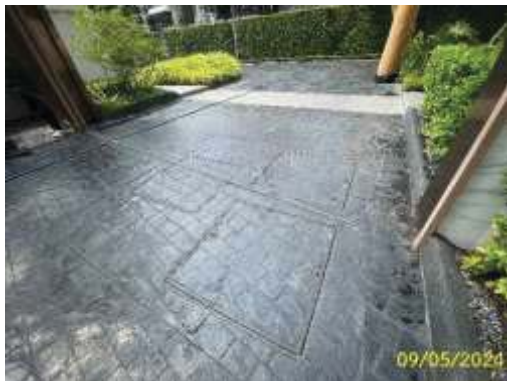
บ่อท่ว่งน้ำ