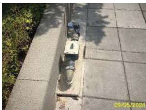
มิเตอร์ประปาของโครงการ

โครงการอาคารชุด โนเบิล สเตท 39 คอนโดมิเนียม รับน้ำจากการประปานครหลวง โดยจะต่อท่อ ประปาผ่านมิเตอร์ เพื่อนำมาเก็บไว้ในถังเก็บน้ำใต้ดินของโครงการ จำนวน 2 ชุด ใช้สำหรับการสำรองน้ำเพื่อการ อุปโภค-บริโภค และสำรองน้ำเพื่อการดับเพลิง ในปริมาณที่เหมาะสม และสูบไปยังถังเก็บน้ำชั้นหลังคา จำนวน 2 ชุด แล้วจึงจ่ายลงมายังส่วนต่างๆ ของอาคาร ทั้งนี้โครงการได้จัดให้มีสระว่ายน้ำเพื่อบริการแก่ผู้พักอาศัยภายในโครงการ อยู่บริเวณชั้นที่ 37 มีการควบคุมคุณภาพน้ำในสระให้ได้มาตรฐานทางด้านสุขาภิบาลตามคำแนะนำของคณะกรรมการ สาธารณสุข ฉบับที่ 1/2550 เรื่อง การควบคุมกิจการสระว่ายน้ำหรือกิจกรรมอื่นๆ โดยจัดให้มีผู้ควบคุมดูแลคุณภาพ น้ำในสระว่ายน้ำตามหลักสุขาภิบาลสิ่งแวดล้อม อีกทั้งมีการติดตั้งป้ายแสดงค่าความเป็นกรด-ด่าง และคลอรีนในแต่ ละวัน และป้ายแสดงข้อปฏิบัติสำหรับผู้ใช้บริการ ติดไว้ในบริเวณสระว่ายน้ำให้มองเห็นได้ชัด และมีข้อความทั้ง ภาษาไทยและอังกฤษ พร้อมอุปกรณ์ช่วยชีวิต บริเวณสระว่ายน้ำของโครงการ แสดงดังภาพที่ 1.3.4-1