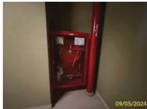
ตู้เก็บสายฉีดน้ำดับเพลิง