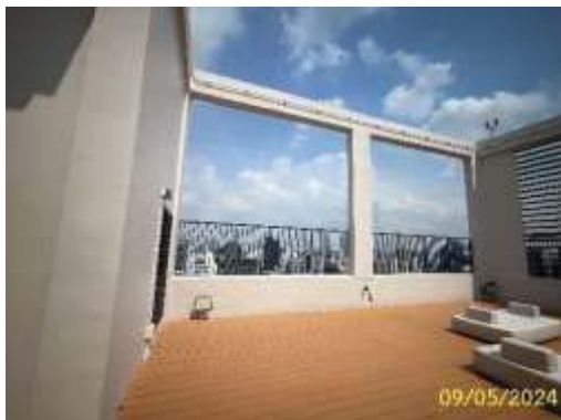
พื้นที่หนีไฟทางอากาศ