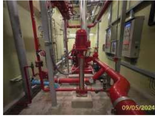
เครื่องปั้มน้ำดับเพลิง