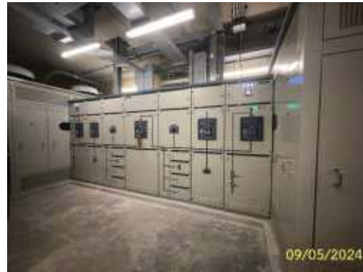
ระบบไฟฟ้าทั่วไป