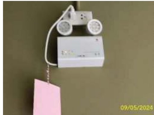
ระบบไฟส่องสว่างฉุกเฉิน