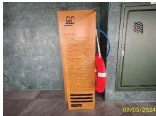
ป้ายแสดงข้อปฏิบัติสำหรับผู้ใช้บริการสระว่ายน้ำ