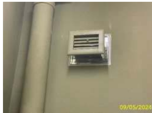
ห้องพักมูลฝอยประจำชั้น ภาพที่ 1.3.7-1 การจัดการมูลฝอย