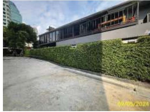
ชั้นที่ 1 (ต่อ)