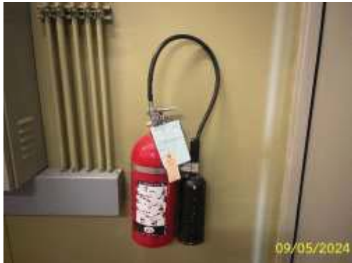
เครื่องดับเพลิงชนิดมือถือ