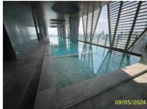
ภาพที่ 1.2-2 สภาพปัจจุบัน