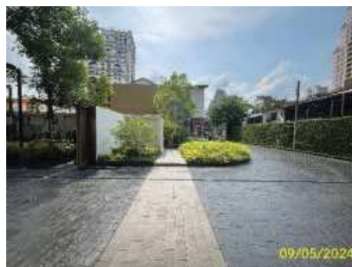
ทางเข้า-ออกโครงการ