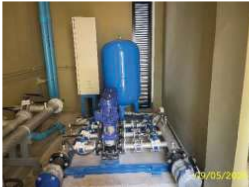
เครื่องปั้มน้ำสำหรับอุปโภค-บริโภค ชั้นดาดฟ้า