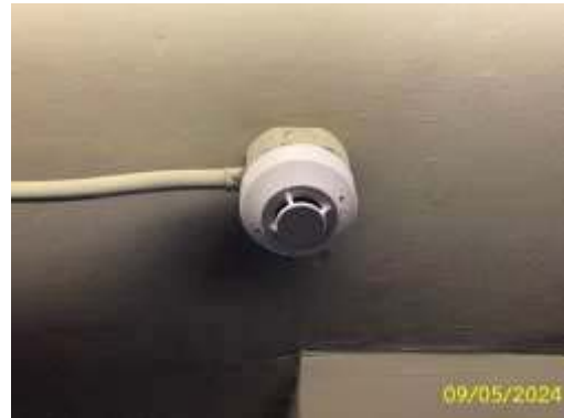
เครื่องตรวจจับควัน/ความร้อน