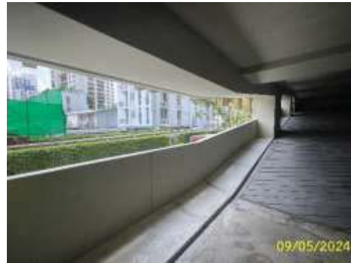
ช่องระบายอากาศบริเวณชั้นจอดรถ