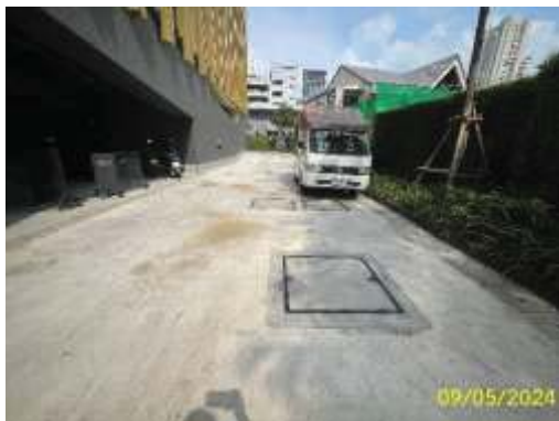
ที่ตั้งระบบบำบัดน้ำเสียของอาคารชุดพักอาศัย

ปัจจุบันโครงการอาคารชุด โนเบิล สเตท 39 คอนโดมิเนียม ได้มีการก่อสร้างระบบบำบัดน้ำเสียแบบชนิดเติมอากาศ Activated Sludge ของโครงการ มีจำนวน 2 ชุด (อาคารชุดพักอาศัย 1 ชุด และอาคารชุดพาณิชย์ 1 ชุด) แต่ละชุดเป็นระบบบำบัดน้ำเสียเบื้องต้น ประกอบด้วย ถังดักไขมัน บ่อเกรอะ ถังปรับสมดุล ถังเติมอากาศ ถังตกตะกอน ถังสูบน้ำขึ้นเหนือ ถังพักสัจจ ถังพักน้ำทิ้ง และบ่อตรวจสอบสภาพน้ำทิ้ง ปัจจุบันโครงการมีน้ำเสียเข้าระบบบำบัดน้ำเสียเฉลี่ย 30 ลูกบาศก์เมตร/วัน โดยระบบบำบัดน้ำเสียมีมอเตอร์ไฟฟ้าแยกเฉพาะในส่วนจากระบบบำบัดน้ำเสียรวมในการคำนวณ ปริมาณการใช้ไฟฟ้าของอุปกรณ์ในระบบบำบัดน้ำเสีย และได้มีการตรวจวัดคุณภาพน้ำทิ้งที่ผ่านการบำบัด บริเวณบ่อตรวจคุณภาพน้ำ จำนวน 1 แห่ง ให้ได้มาตรฐานเป็นไปตามอ้างอิงตามประกาศกระทรวงทรัพยากรธรรมชาติและสิ่งแวดล้อม เรื่องกำหนดมาตรฐานควบคุมการระบายน้ำทิ้งจากอาคารบางประเภทและบางขนาด พ.ศ. 2548 (ประเภท ข) แสดงดังภาพที่ 1.3.5-1