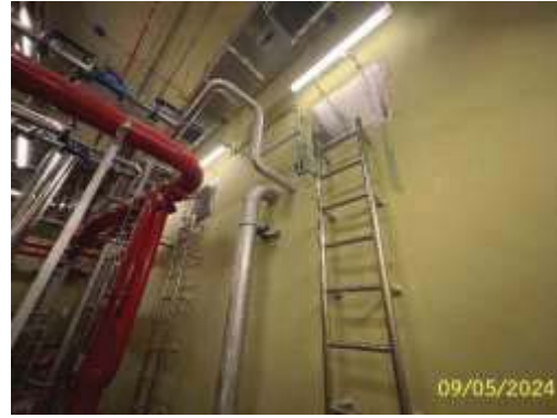
ถังน้ำสำรองดับเพลิง