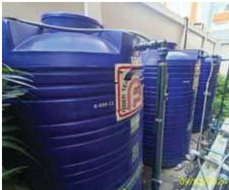
ถังสำรองน้ำอาคารพาณิชย์