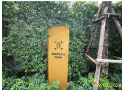
ป้ายจุดรวมพล