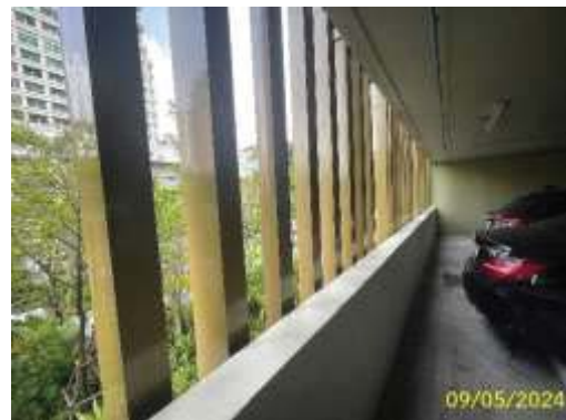
ภาพที่ 1.3.3-1 (ต่อ) ระบบการจราจรของโครงการ