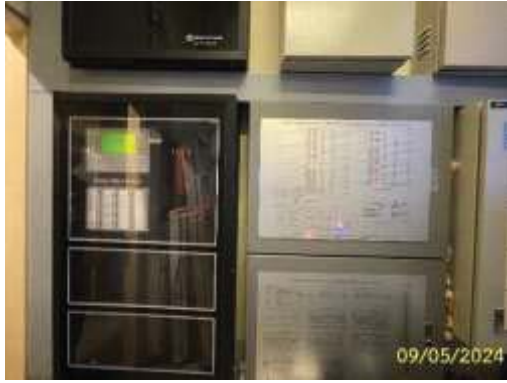
แผงควบคุมระบบสัญญาณแจ้งเพลิงไหม้