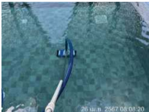
เจ้าหน้าที่ทำความสะอาดสระว่ายน้ำ