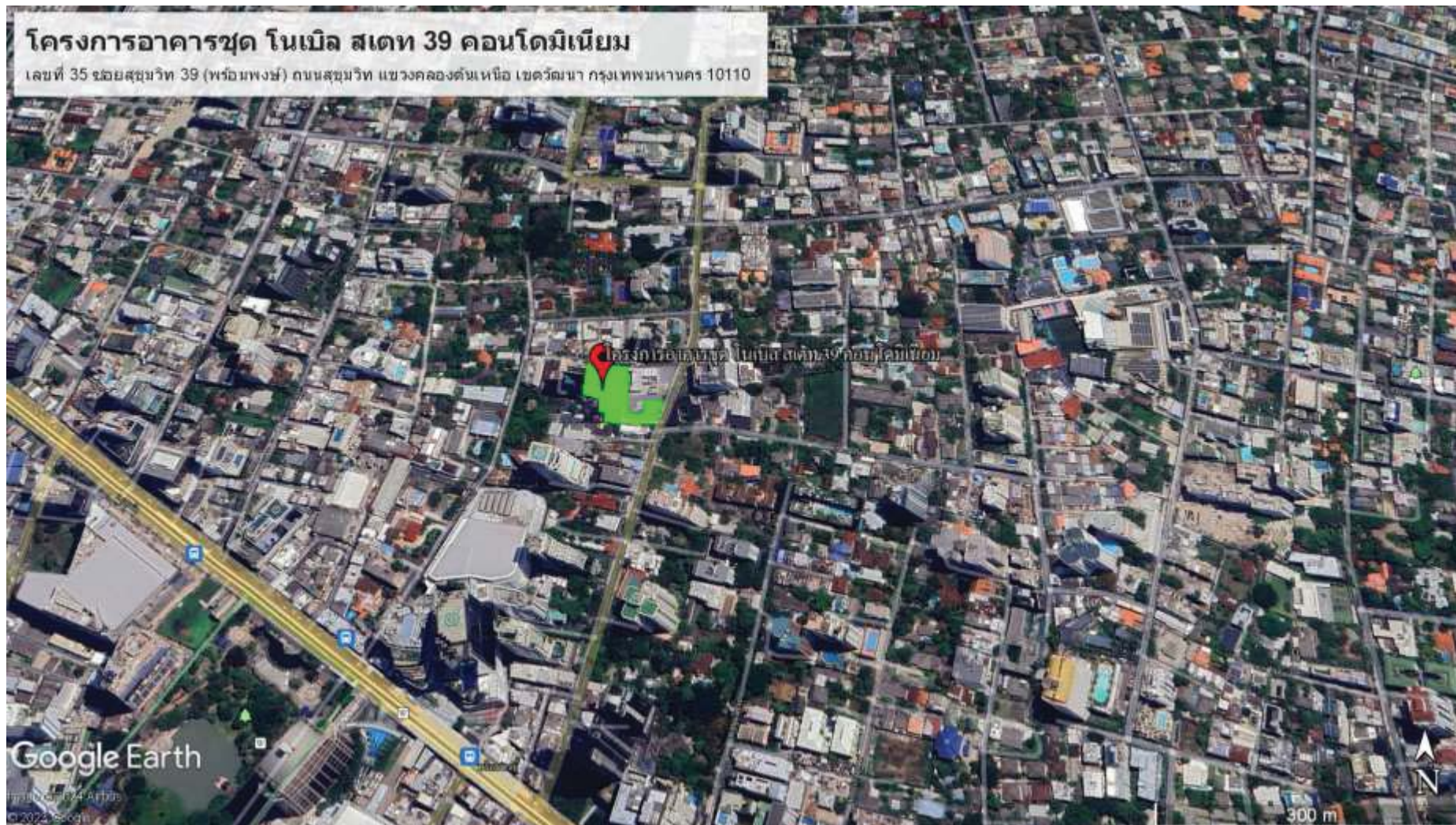
ภาพที่ 1.2-1 ที่ตั้งโครงการ