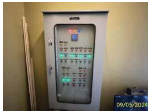
ตู้ควบคุมระบบบำบัดน้ำเสีย