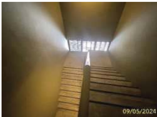
บันไดหนีไฟ ST-1