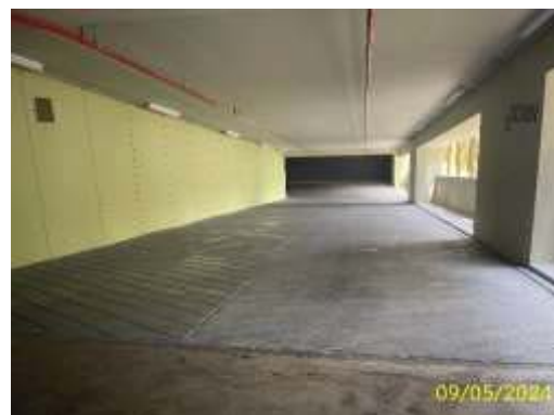
ทางเข้า-ออกพื้นที่จอดรถ