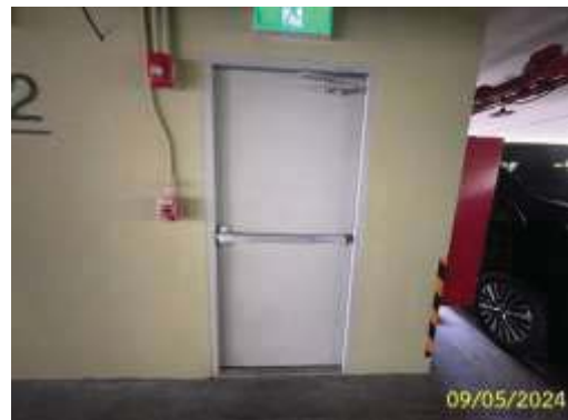
ประตูหนีไฟ