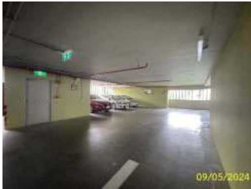
พื้นที่จอดรถยนต์แบบปกติ