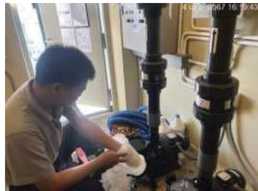
ตรวจเช็คระบบต่างๆ ของสระว่ายน้ำ