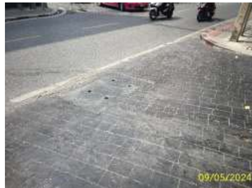
ท่อระบายน้ำบริเวณหน้าโครงการ