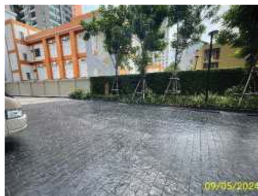
ถนนภายในโครงการ