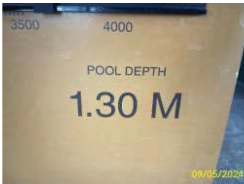
ป้ายบอกความลึก