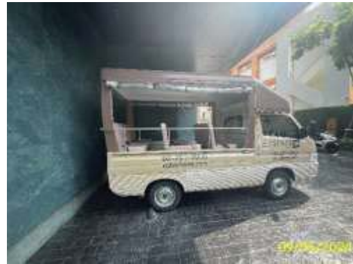
รถบริการ