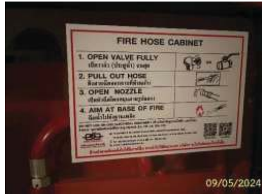
ป้ายแนะนำการใช้อุปกรณ์ดับเพลิง