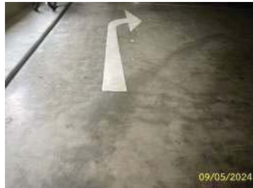
ป้าย/สัญลักษณ์จราจร