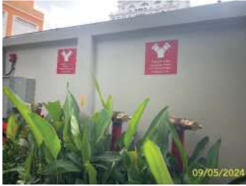
หัวรับน้ำดับเพลิงนอกอาคาร