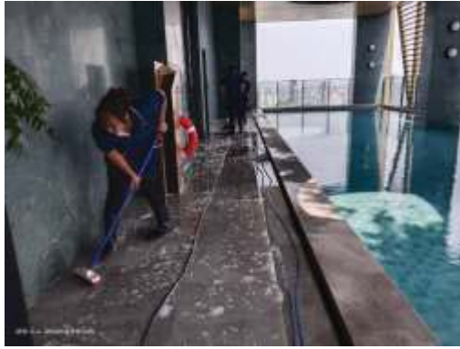
เจ้าหน้าที่ทำความสะอาดบริเวณสระว่ายน้ำ