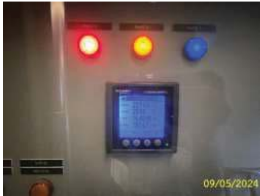
มิเตอร์ไฟฟ้าระบบบำบัดน้ำเสีย