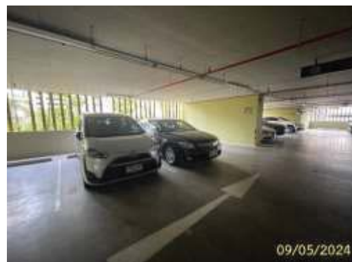
พื้นที่จอดรถยนต์แบบปกติ