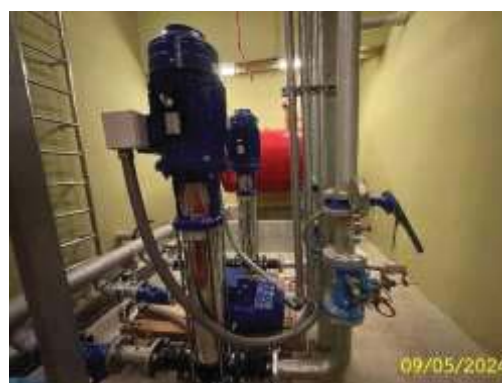
เครื่องปั้มน้ำสำหรับอุปโภค-บริโภค ชั้นใต้ดิน