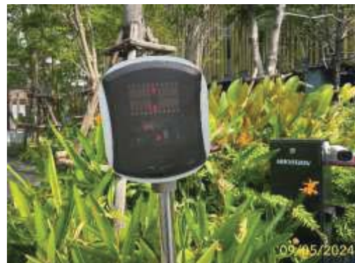
ระบบบัตรผ่านเข้า-ออก