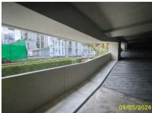
ผนังกันตกชั้นลานจอดรถยนต์