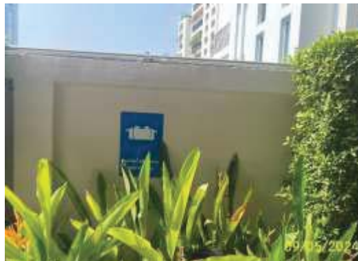
ป้ายบ่อบำบัดน้ำเสียโครงการ