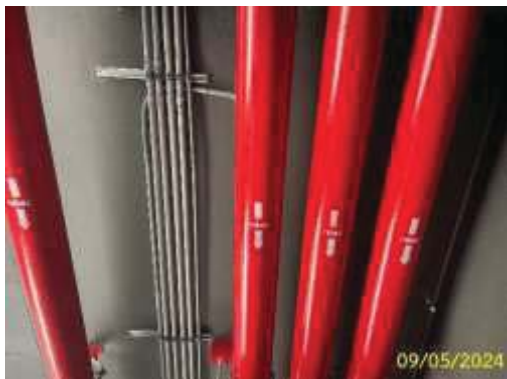
ระบบท่อน้ำดับเพลิงหรือท่อยื่น