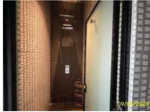
จุดล้างตัว