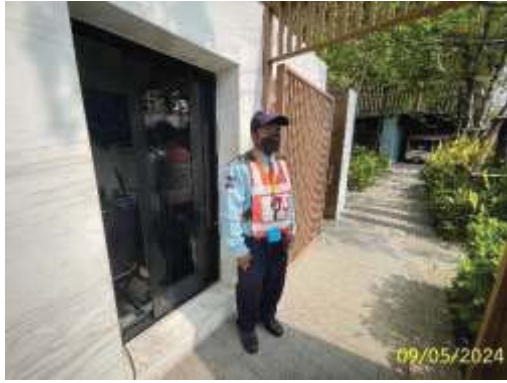
เจ้าหน้าที่รักษาความปลอดภัย