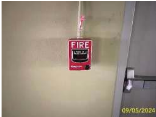
เครื่องแจ้งเหตุโดยใช่มือดึง